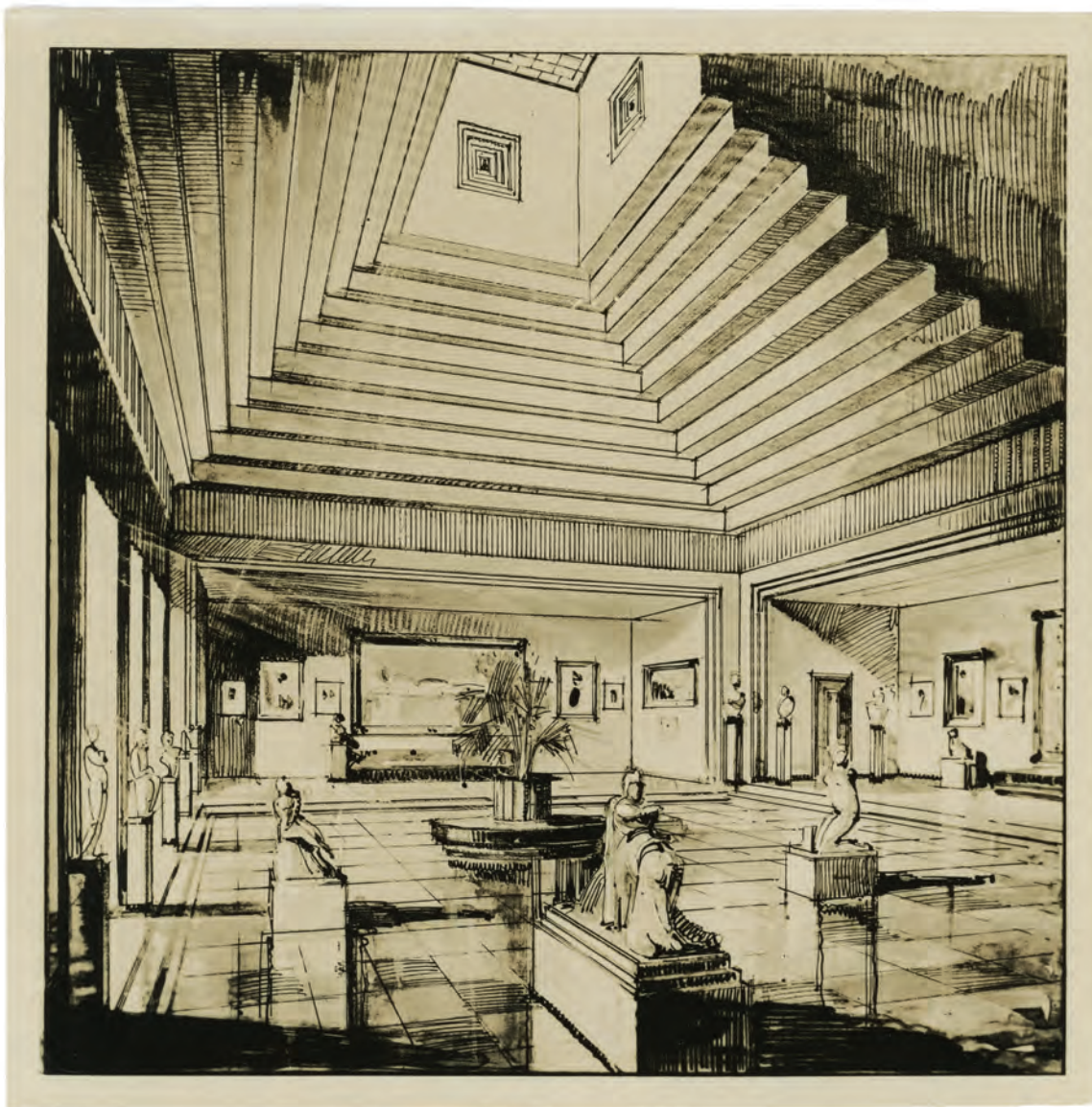
Foto de boceto arquitectónico de Alejandro Virasoro de la Casa del Teatro. Copia a la gelatina de plata (13,7 x 13,7 cm). Circa 1927

[Sección 6. "Documentos visuales", Fondo Enrique García Velloso, CeDInCI]